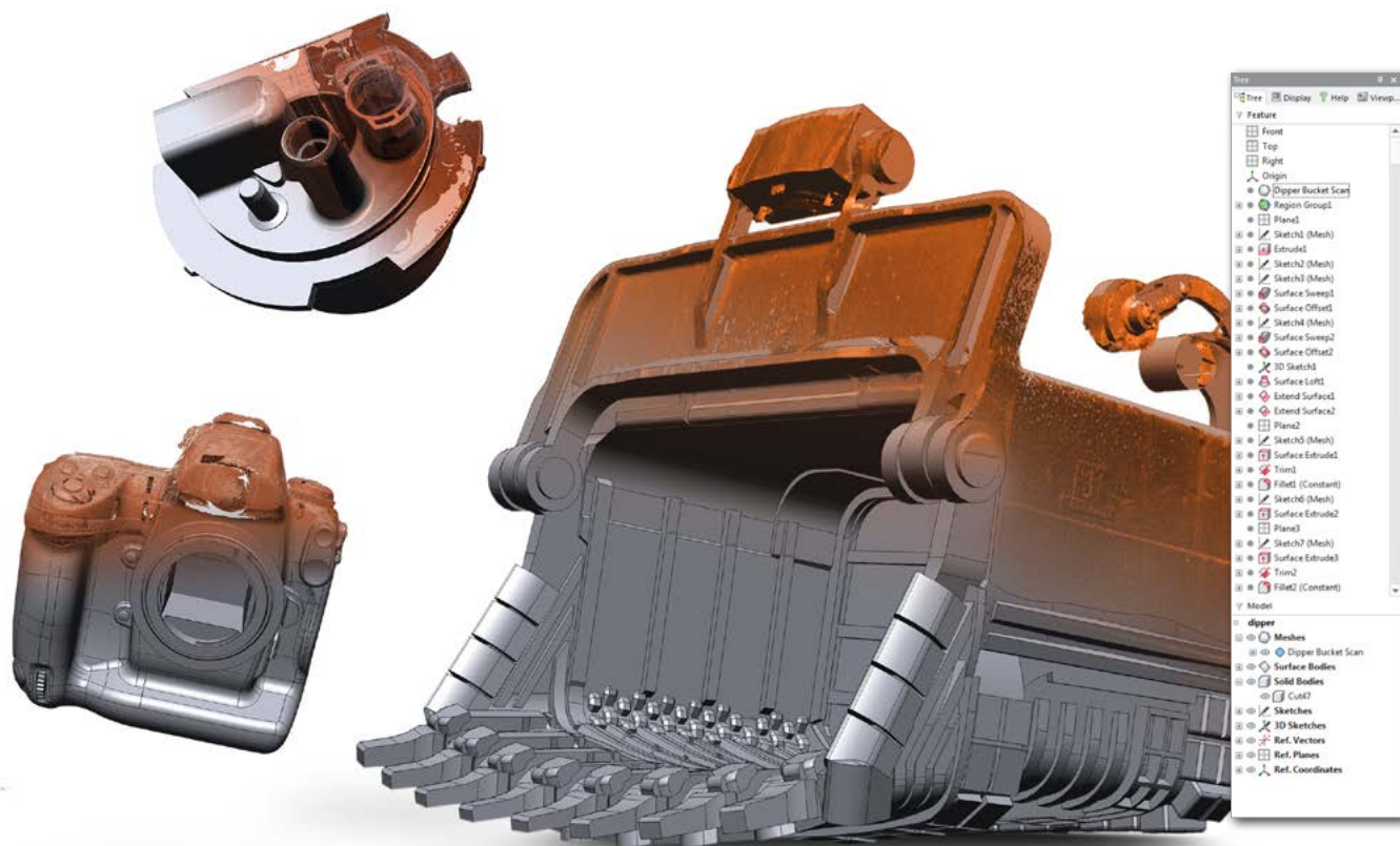
在 Geomagic Design X 中创建的参数化实体模型

如果对已构建部件和已设计部件进行建模,则会节省大量资金和时间。对 CAD 模型进行变形处理以拟合 3D 扫描。通过使用实际部件几何形状来修正 CAD 并消除部件回弹问题,从而减少工具重复成本。减少因为与其他组件拟合不佳而造成昂贵费用的错误。